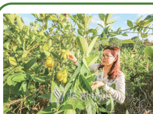
石扇鎮積極引進新農人，爲鄉村振興提供強大人才支撐。