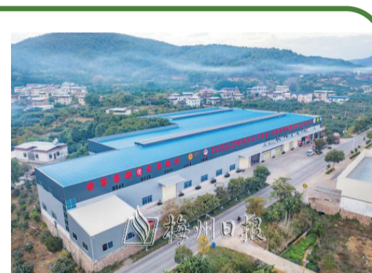
石扇鎮做大做強金柚流通電商產業，爲梅縣金柚提質、增效、亮牌。