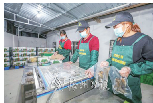
鬆林村成立咸菜研發項目部，推動特色產業可持續發展。